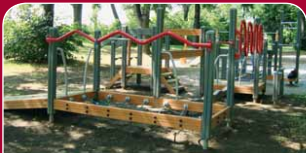
Řepčín, park – nové dětské hřiště pro starší děti se sportovní lavicí, překážkovou dráhou, kladinou, tříhradnou a prvkem pro strečink, 493 tisíc korun