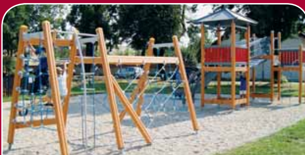
Chválkovice, Kubátova – nové dětské hřiště s kolotočem, houpačkou, vahadlovou houpačkou, věží s lanem a žebříkem, multifunkční sestavou se skluzavkou a pískovištěm, 752 tisíc korun