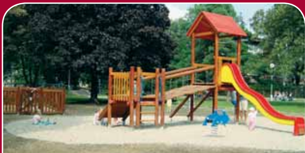
Nové Hodolany, park u Blanické ulice – nové hřiště s herní sestavou, oploceným pískovištěm, pružinovým houpadlem, 427 tisíc korun