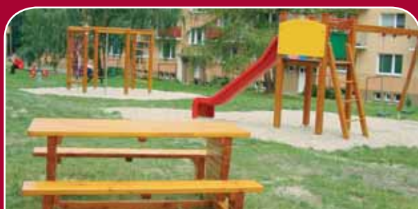
Nová Ulice, Vojanova – úprava a dovybavení multifunkční sestavou se skluzavkou a lezeckými prvky, kolotoč, pružinová houpadla, lezecký šestiúhelník, lavičky a koše, 538 tisíc korun