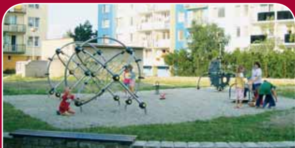
Povel, Kischova – úprava a dovybavení kolotočem, houpadlem, lezeckým prvkem a síťovým herním prvkem, 532 tisíc korun