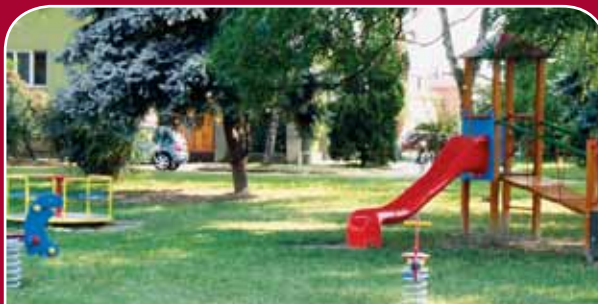
Chválkovice, Veverkova – úprava a dovybavení o věžovou sestavu se skluzavkou, kolotočem a pružinová houpadla, 205 tisíc korun