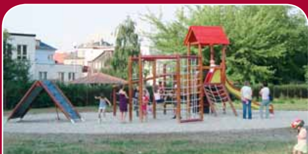
Povel, Mišákova – dovybavení herní sestavou, šplhací sestavou, lezeckou sestavou a osázení zeleně, 389 tisíc korun