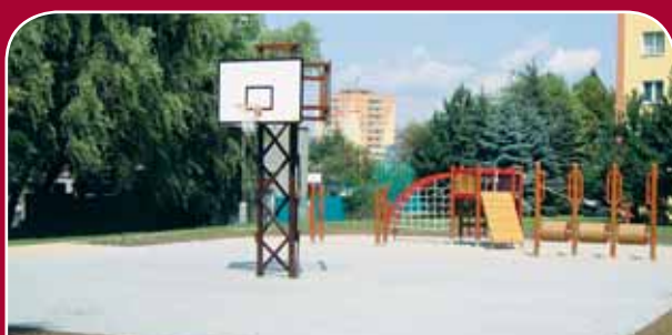
Tabulový Vrch, V Hlinkách – nové dětské hřiště se sportovním zaměřením s herní sestavou, bradly, ping-pongovými stoly a streetballovými koši, 620 tisíc korun