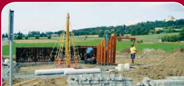
Droždín, Pplk. Sochora – nové hřiště s klasikou houpačkou, pružinovými houpadly, točitou skluzavkou, kolotočem, lanovou pyramidou a oploceným pískovištěm, 820 tisíc korun