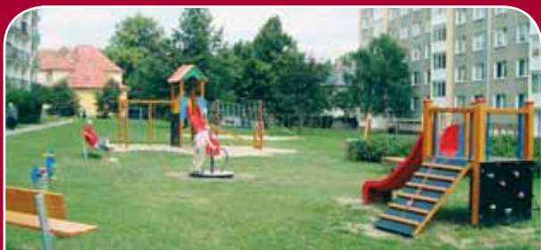
Nová Ulice, Hraniční – úprava a dovybavení o multifunkční sestavu se skluzavkou, kolotočem, pružinová houpadla, lezecké prvky, lezecká síť, závěsná houpačka, dvě lavičky, 613 tisíc korun