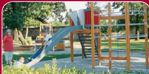
Holice, park u ZŠ – dovybavení houpačkou, věží se sítěmi, skluzavkou se schodištěm a lezeckou věží, 430 tisíc korun