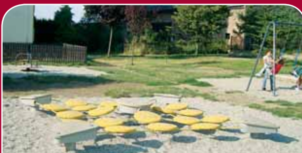
Holice, náves Svobody – úprava a dovybavení oplocením pískoviště, síťových prvků, kolotočem, pružinovým houpadlem a houpačkou, 520 tisíc korun